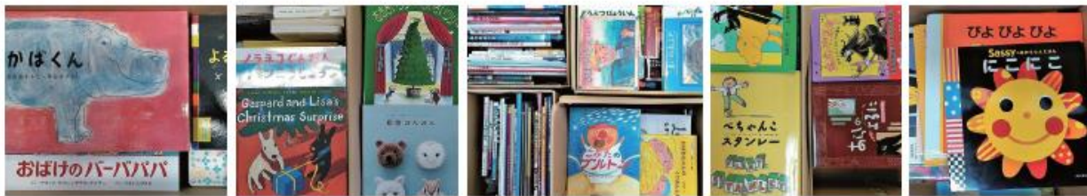
※寄付いただいた絵本（一部抜粋）